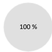
1. Alignement des investissements sur la taxinomie, obligations souveraines incluses*

Les deux graphiques ci-dessous font apparaître en vert le pourcentage minimal d'investissements alignés sur la taxinomie de l'UE. Étant donné qu'il n'existe pas de méthodologie appropriée pour déterminer l'alignement des obligations souveraines* sur la taxinomie, le premier graphique montre l'alignement sur la taxinomie par rapport à tous les investissements du produit financier, y compris les obligations souveraines, tandis que le deuxième graphique représente l'alignement sur la taxinomie uniquement par rapport aux investissements du produit financier autres que les obligations souveraines.