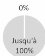
2. Alignement des investissements sur la taxinomie, en dehors des obligations souveraines*

■ Alignés sur la taxinomie ■ Autres investissements