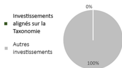
1. Alignement des investissements sur la taxinomie, dont obligations souveraines*